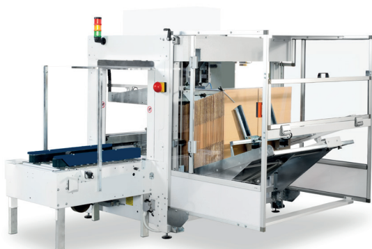
CT 3000 avec scellant de fond CT 302 SD