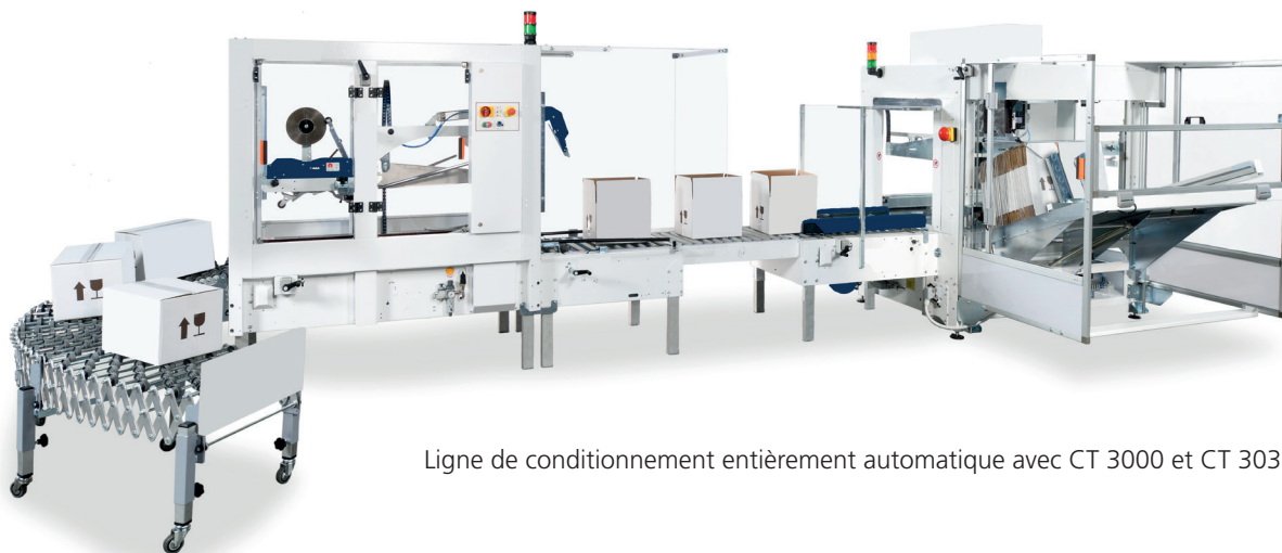
Ligne de conditionnement entièrement automatique avec CT 3000 et CT 303 SDF

Avec la CT 3000, il est possible d'assembler professionnellement des milliers de cartons par jour.